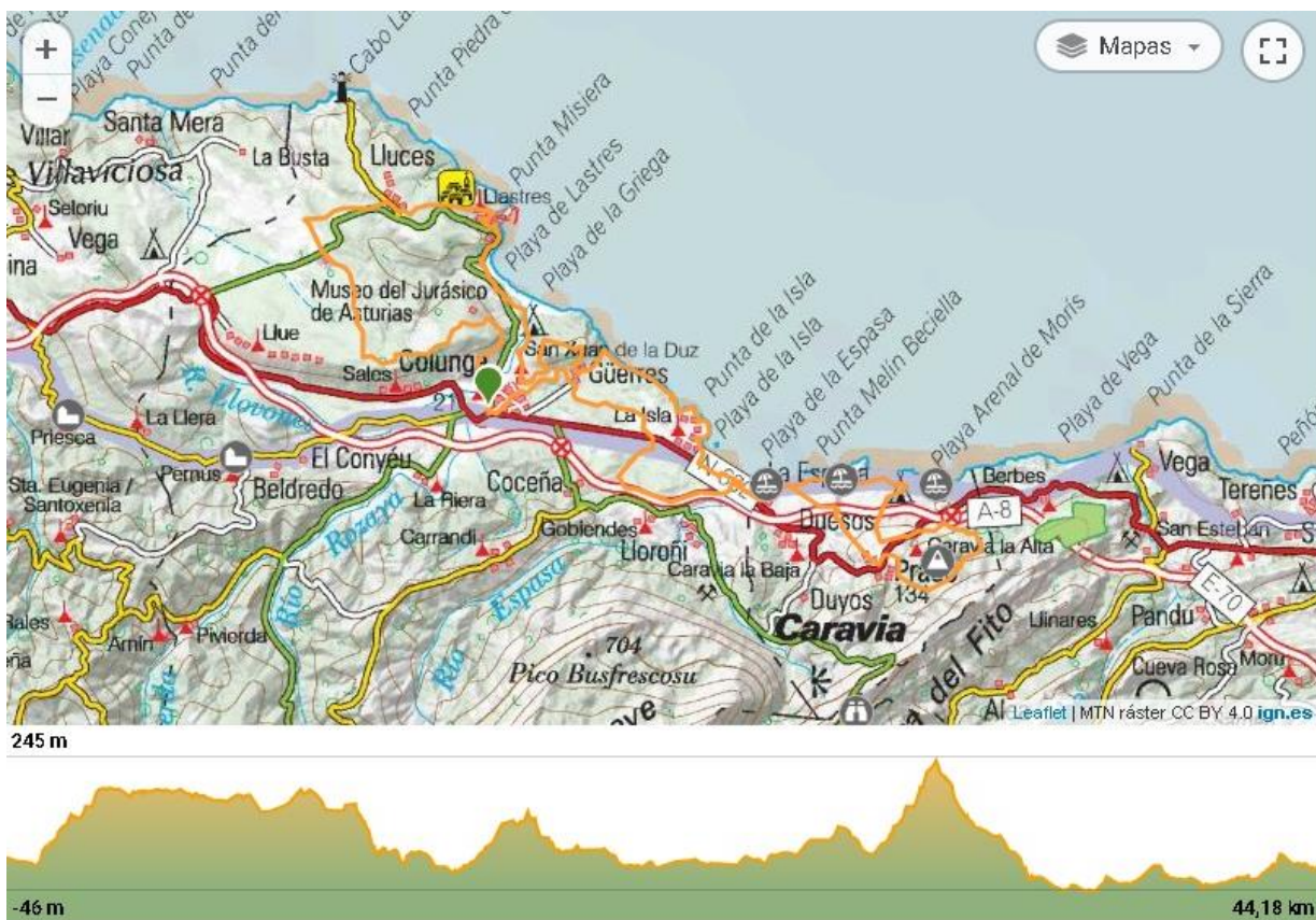
LARGO (44 Km aproximadamente)