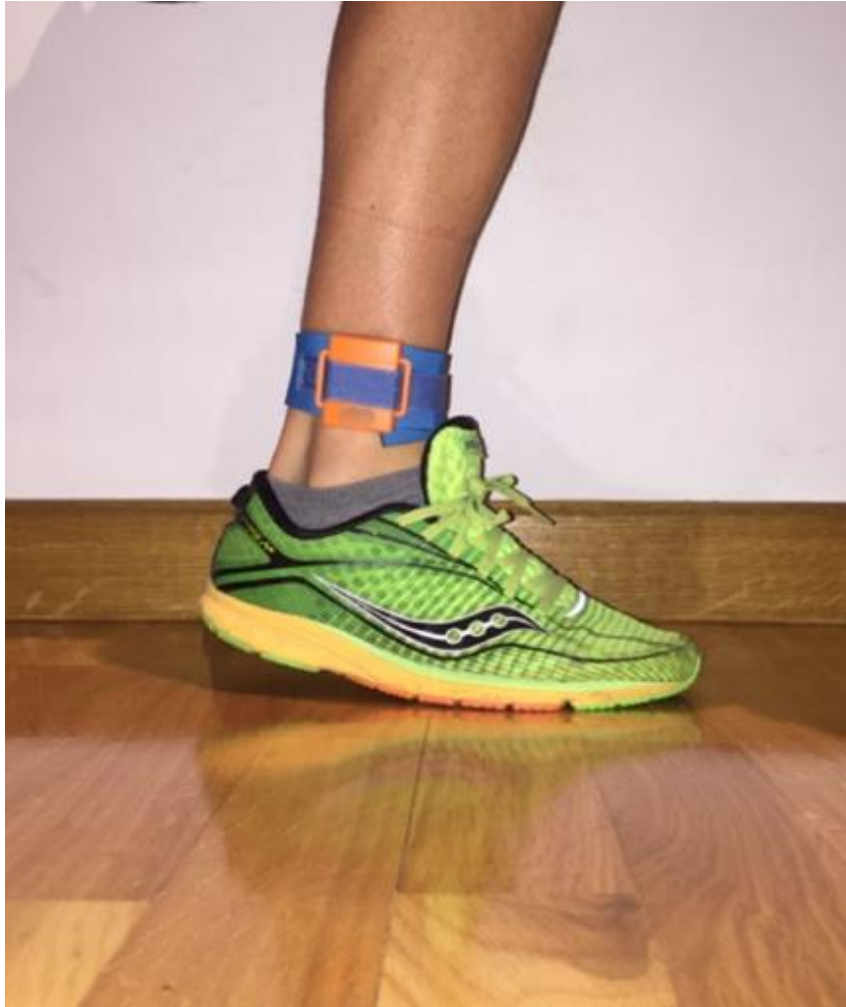
Situación del chip en la tobillera (testigo a intercambiar)

Después del arco de meta se instalarán en el lado izquierdo de la calzada del circuito tres (3) zonas de espera de relevo de longitud variable en función de los equipos inscritos en cada categoría y separados por una valla. En estas zonas se acomodarán las corredoras y corredores a la espera de relevo conforme a la siguiente distribución: